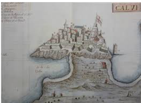
La ville de Calvi au XVI e siècle