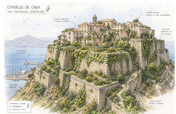
Citadelle végétalisée. Image générée par IA.

Les élèves souhaitent également créer des jardins méditerranéens avec des plantes peu gourmandes en eau (caroubiers, pistachiers, figuiers de barbarie). En végétalisant certains espaces, la citadelle deviendrait plus agréable, plus fraîche et favoriserait la biodiversité. Autre idée : récupérer l'eau de pluie dans des réservoirs afin d'arroser les plantations et d'entretenir les lieux de façon responsable.