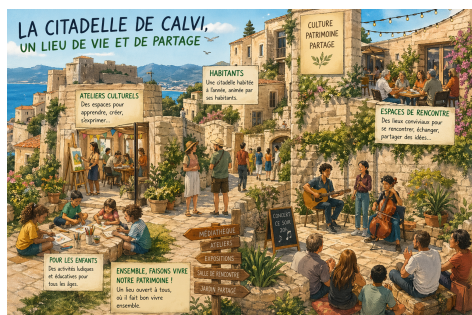
Un lieu de vie et de partage .Image générée par IA