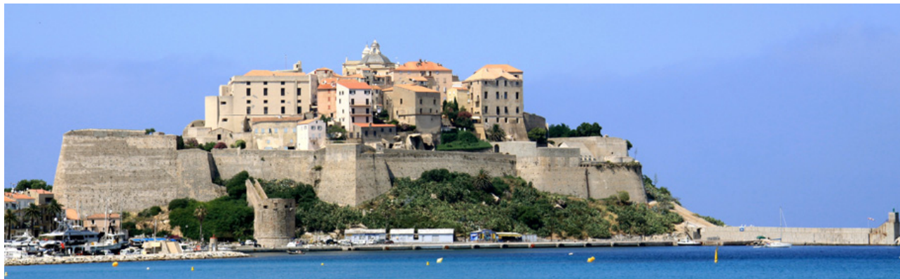
Citadelle de Calvi.

https://www.la-corse.travel/citadelle-de-calvi .